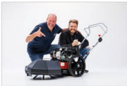
Referenz-Technik für die Wildkraut-beseitigung