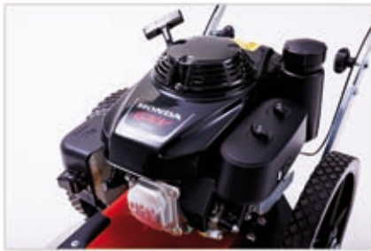
Hondamotor GXV 160 OHV