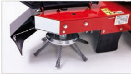
Schnellwechselsystem der neuesten Generation

Ideal für Stadtreinigung, Grundstückspflege und Hausmeisterservice